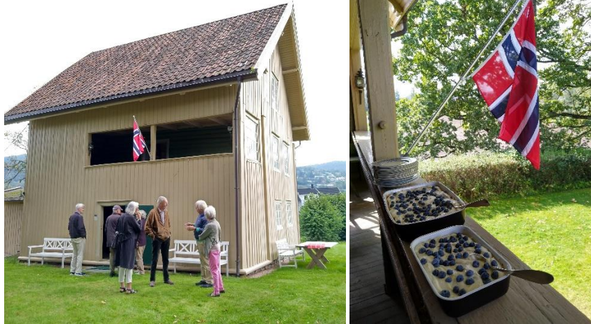
Lystgården Stillesholmen, fra svalgangen på fremsiden