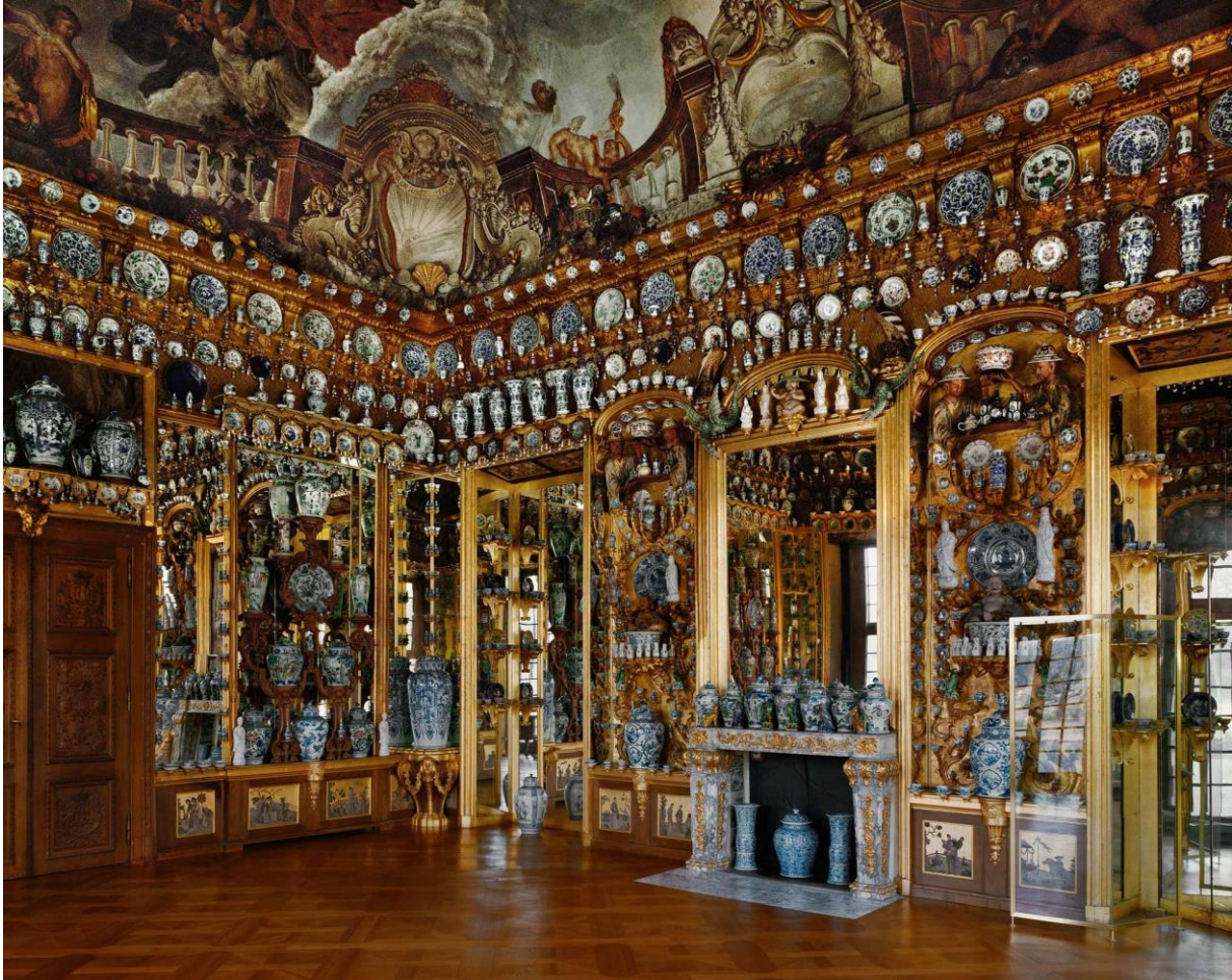
Figur 3: Porselenskabinettet i Charlottenburg slott.

samling på 151 eksklusive kinesiske porselensvaser som tilhørte den prøyssiske kongen. Vasene var opprinnelig en del av samlingene i palassene Oranienburg og Charlottenburg.