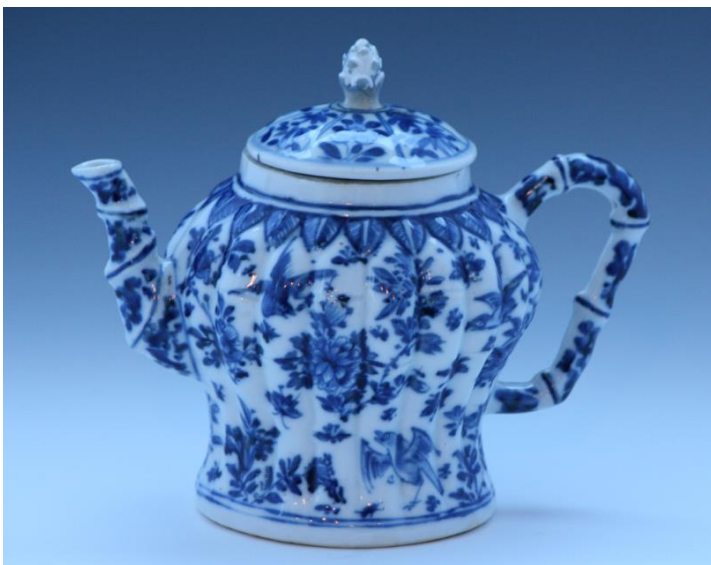
Figur 4: Blåhvit tekanne fra August den sterkes samling.