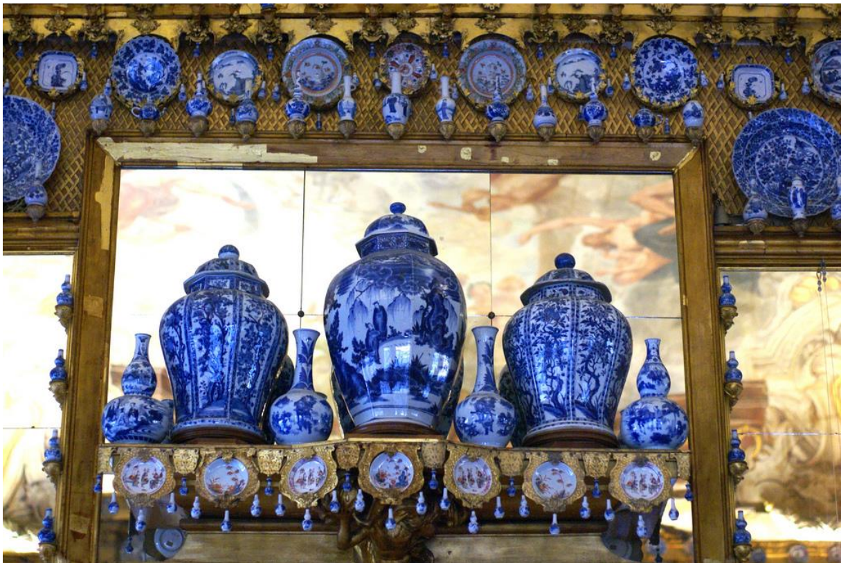
Figur 2: Kinesisk porselen i porselenskabinettet i Charlottenburg. Slottet ble ødelagt av bombing under annen verdenskrig, men er gjenoppbygd.

I 1687 da August var en ungdom på 17 år, besøkte han kong Louis XIV i Versailles. Der skal han ha sett Trianon de Porcelaine som kongen lot oppføre i 1671 for sin maitresse Madame de Montespan. I 1709 besøkte August den sterke porselenskabinettene i Oranienburg i Brandenburg og Charlottenburg i Prøysen. Dette skal ha vært starten på hans interesse for kinesisk og japansk porselen. Først i 1715 begynte han selv å samle i større omfang, og han fortsatte å erverve porselen i store mengder frem til sin død.