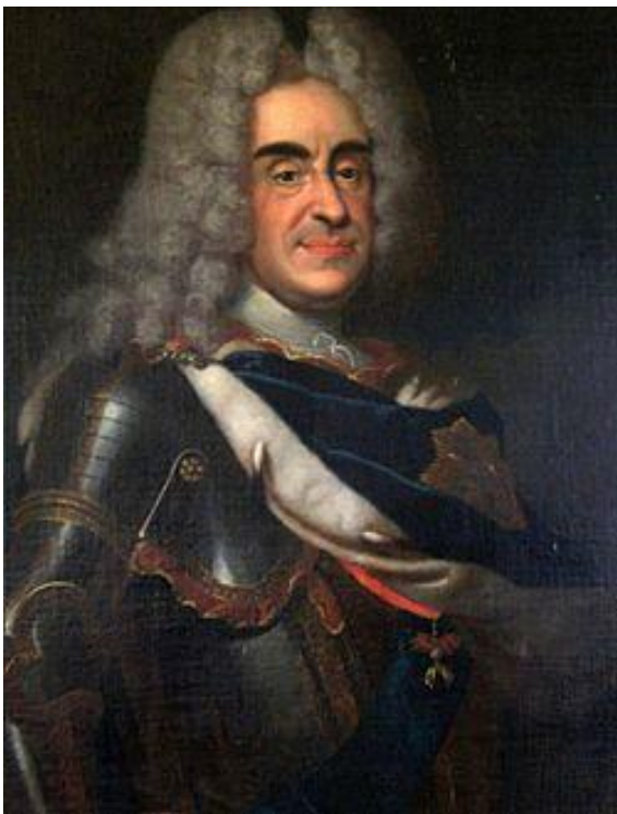
Figur 1: Portrett av August den sterke

Blant alle de kongelige porselenssamlerne var det ingen som overgikk August den sterke (1670 – 1733). Hans fulle navn var Friedrich August I, og han var fra 1694 til sin død i 1733 kurfyrste av Sachsen. I 1697 ble han valgt til konge av Polen under navnet August II. Han gjorde residensbyen Dresden til et av Europas viktigste kultursentra, blant annet ved å bygge opp store kunstsamlinger.