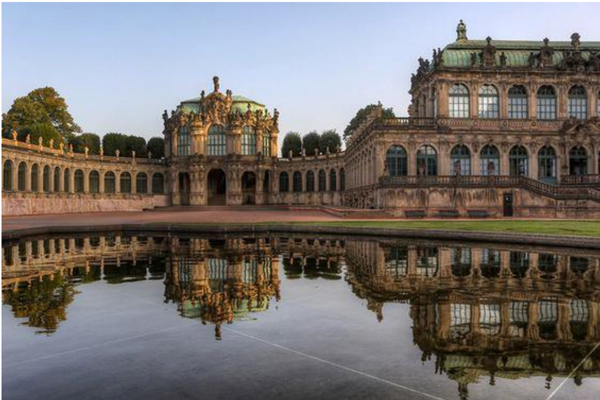
Figur 6: Zwinger i Dresden inneholder Sachsenfyrstenes kunstsamling. Porselenssamlingen er utstilt i første etasje. Zwinger ble bombet under annen verdenskrig, men er gjenoppbygd.

Den største delen av den store evakuerte porselenssamlingen overlevde ødeleggelsene under andre verdenskrig og ble flyttet til daværende Sovjet i 1945. Mange av objektene ble utstyrt med et sovjetisk katalognummer. I 1958 ble samlingen returnert til Dresden. I 1962 ble gjenstandene installert i Zwinger som ligger like i nærheten av August den sterke residens. Bygningskomplekset Zwinger ble oppført av August den sterke som galleri for den kongelige kunstsamlingen. I likhet med residensen og store deler av Dresden ble anlegget bombet av de allierte militære styrker på slutten av andre verdenskrig. Zwinger er senere gjenoppbygd.