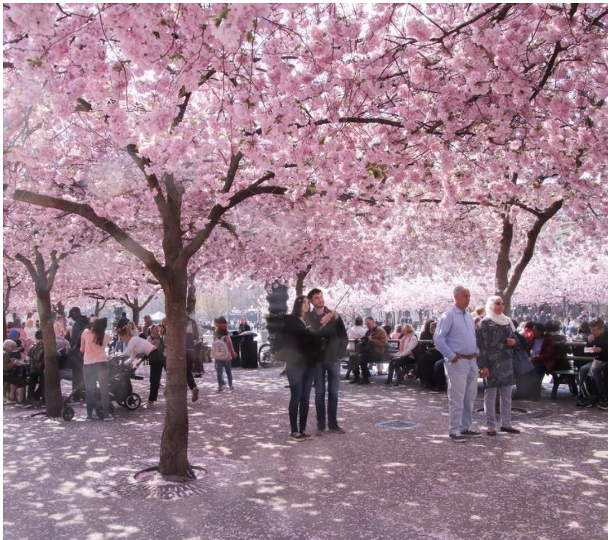
Hanami sakura i Kungsträdgården i Stockholm

Nå har vi en nydelig tid foran oss. Et av vårens vakreste syn er kirsebær i blomst. Noen reiser til Japan for å oppleve det, men man trenger ikke dra så langt. En trivelig togtur unna ligger Stockholm. Der inviterer Japanska föreningen til "Körsbärsblommans dag" lørdag 18. april i Kungsträdgården, med japansk mat, workshops og aktiviteter. Kungsträdgården har mange kirsebærtrær, men rundt omkring i byen finnes det ytterligere over 10 000 av dem, så mulighetene for å se dem i blomst er mange. Men vær obs på at blomstringen kan bli tidlig i år!