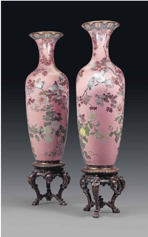
To japanske cloisonnévaser fra Meiji-perioden (1868-1912). Høyde 153 cm