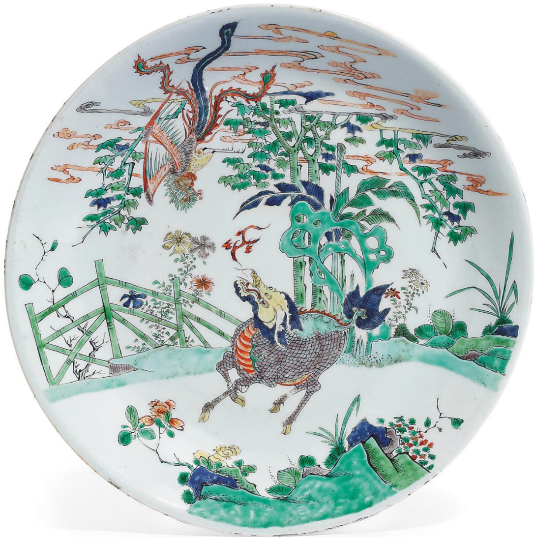
Famille verte fat, motiv mytiske dyr. Kangxi periode (1662-1722). Diameter 38,5 cm

Tid og sted: Tirsdag 12. mai klokken 19 i Røde sal på Schafteløkken