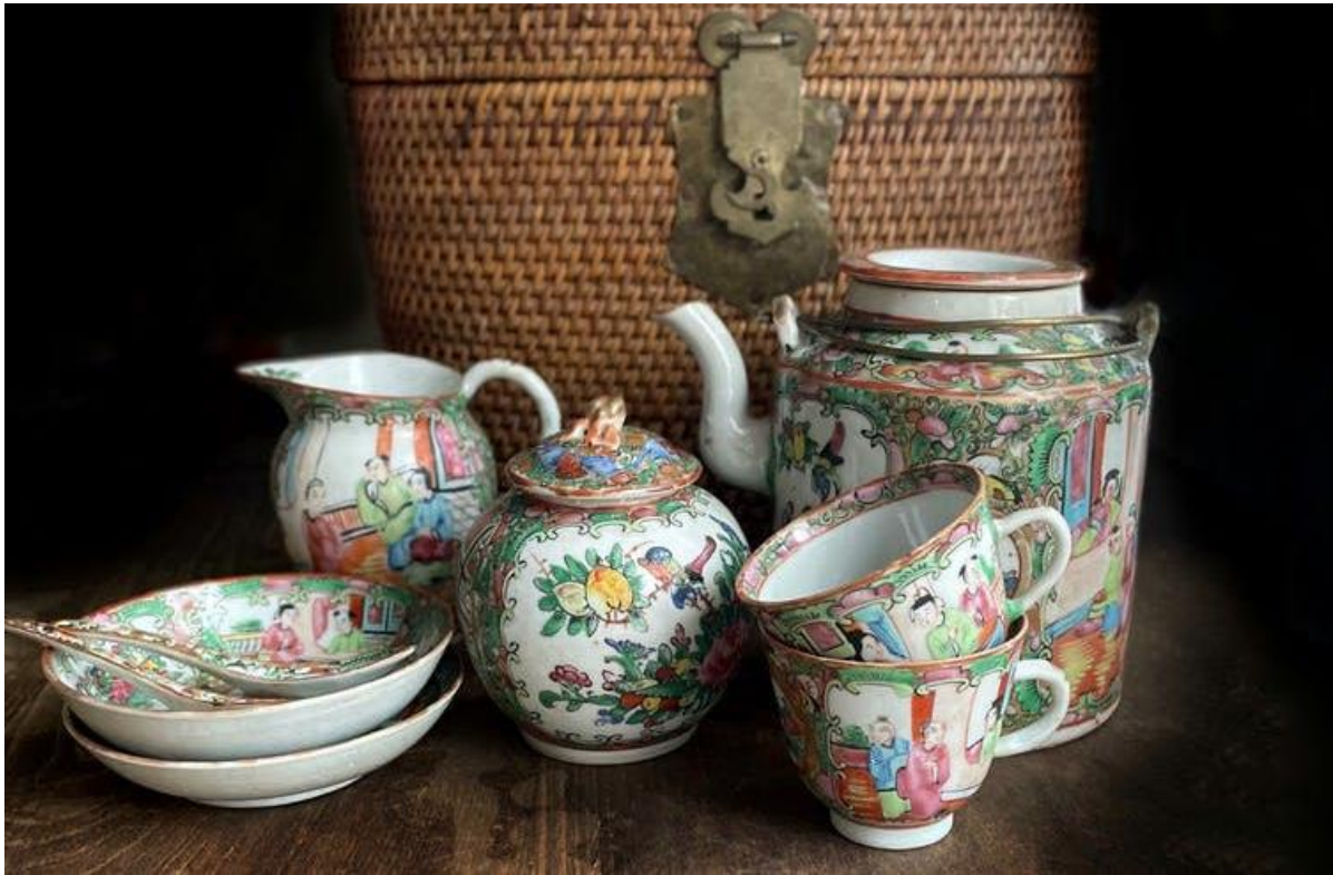
Tesett, Canton Medallion, Famille Rose, Kina, sen Qing-dynasti