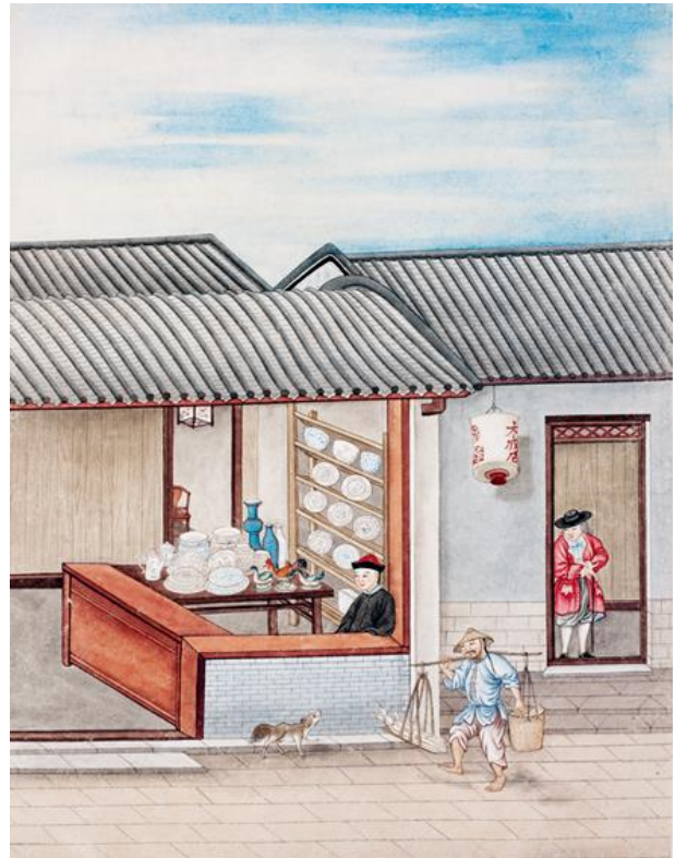
Porselenselger. Akvarell av et utsalg i Guangzhou ca 1730. Tilhører Lund universitetsbibliotek.

Ta med venner og familie og kom! Vi sender ut egen invitasjon i mai.