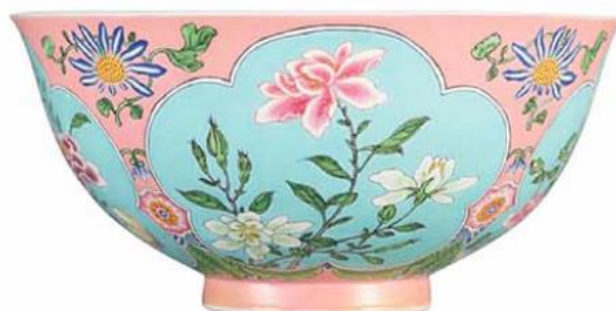
Kangxi-bolle som nylig ble solgt på auksjon for 30,4 mill. USD (Ref. Arts of Asia May-June 2018 issue)