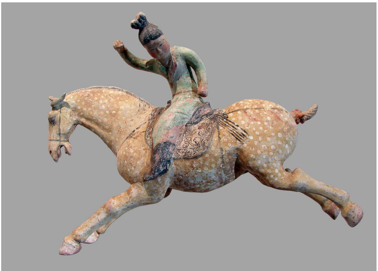
Kvinnelig polospiller fra Tang-dynastiet. Nord-Kina, første halvdel av 8. årh. e.Kr. Tilhører Musée Guimet, Paris.