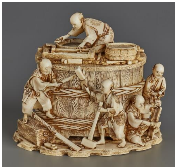
Japansk okimono i elfenben, 1800-tallet, lengde 8 cm