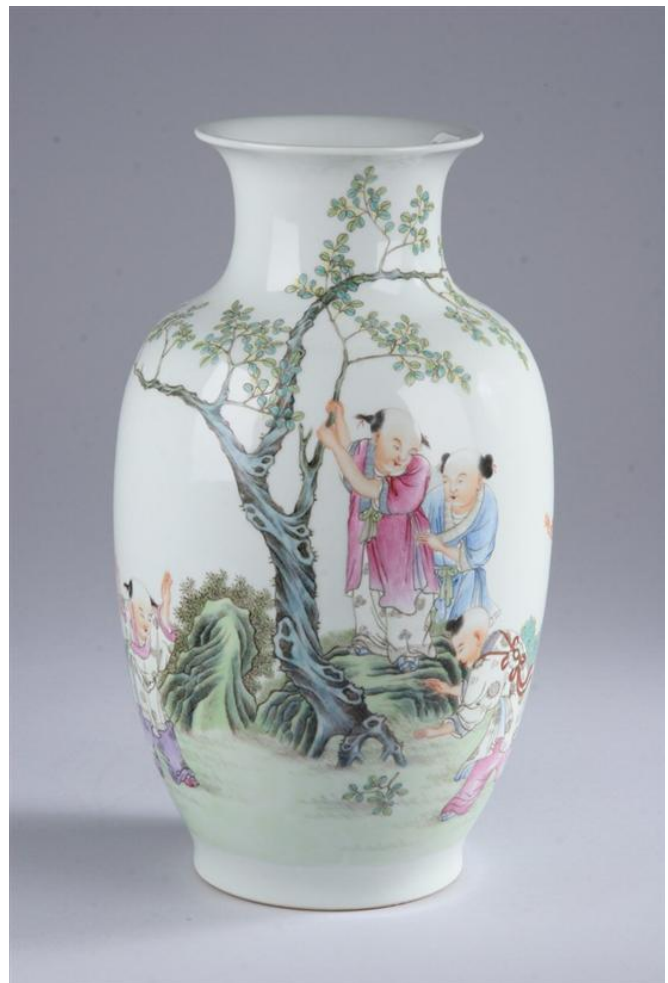
Famille Rose vase, gutter som leker, Republikk, h: 34 cm

Tid og sted: Mandag 29. april klokken 19 på Schafteløkken. Som vanlig blir det lett bevertning.