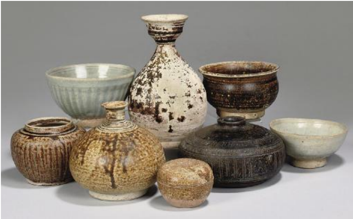
Sawankhalok-keramikk tidligere solgt på Christie's