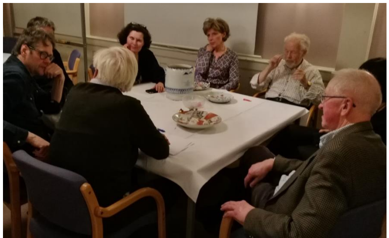
Fra gjenstandskvelden i februar