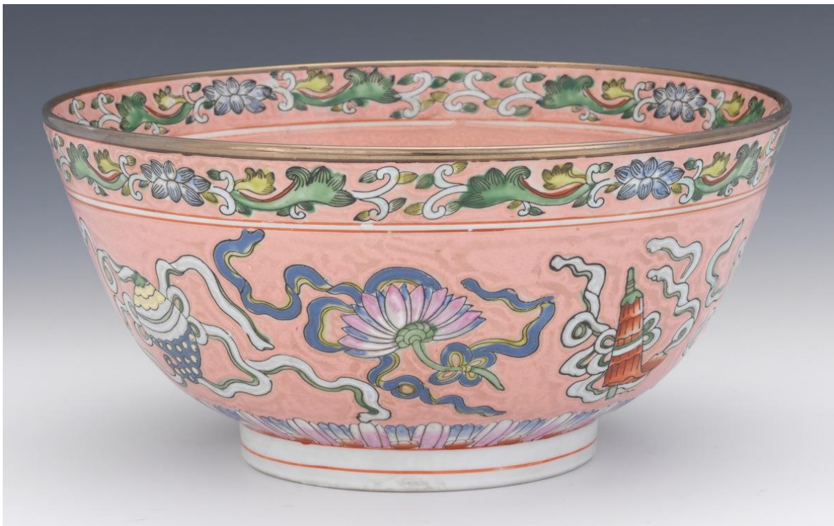
Punchebolle, Famille Rose, 1800-tallet, Kina. D: 30,5 cm

I oktober skal vi igjen arrangere en Pecha kucha-dag, et etter hvert fast innslag på høstprogrammet. Grunnen til at dette nevnes allerede nå er at dere da får tid til å tenke etter om det er noe dere vil bidra med! En Pecha kucha er altså et miniforedrag, i sin rene form er det 20 bilder med 20 sekunders taletid til hvert bilde. Så rigide er ikke vi, et syv til ti minutters foredrag er veldig bra, gjerne med bilder. Det er vide grenser for hva et slikt foredrag kan romme, vi har tidligere hatt en stor variasjon av fengende temaer. Vi får ikke mer moro enn vi skaper selv, så tenk på om det er noe nettopp du har lyst til å dele med de andre medlemmene.