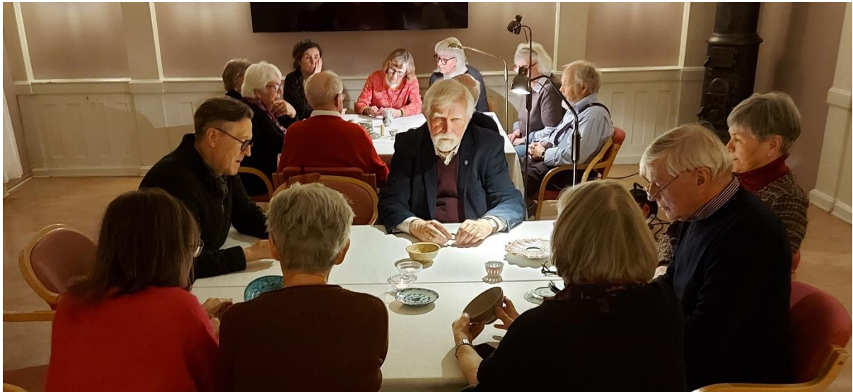
Gjenstandshåndtering i Røde sal på Schafteløkken