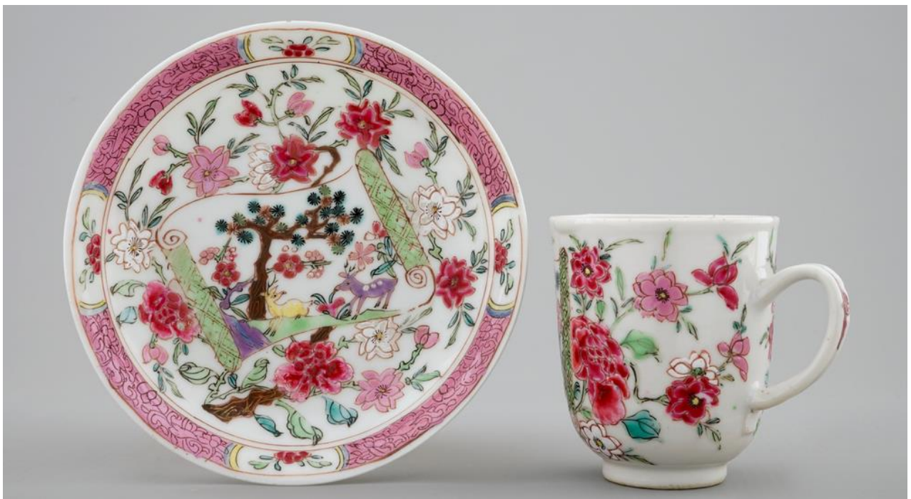
Kopp og skål, Famille Rose -dekor, Kina, Yongzheng/Quianlong