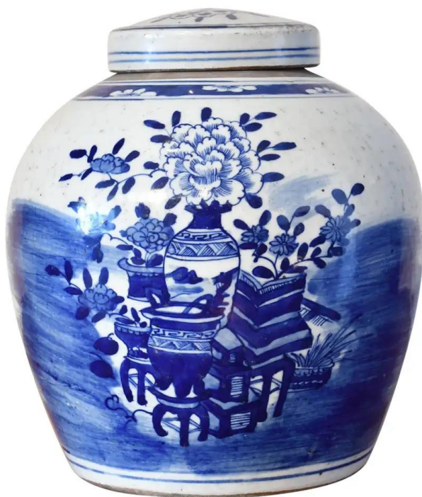
Blåhvit ingefærkrukke, motiv "One hundred treasures", Kangxi, ca 1750

Tid og sted: torsdag 3. desember klokken 19 i Store sal på Schafteløkken