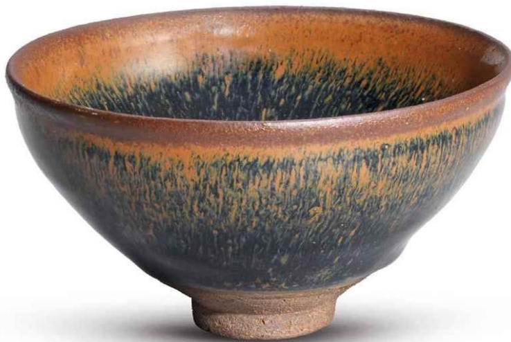
Jian tebolle med hare's fur -dekor, Kina, Southern Song dynastiet (960-1279)

Styret i NSOK hadde sett frem til å møtes på tur nå 22. august. Hele 51 medlemmer hadde meldt seg på turen, så det er tydelig at vi var mange som har følt på savnet av å treffes. I dagene før avlysningen kom imidlertid myndighetene med anbefalinger om å vise ekstra aktsomhet på grunn av oppblomstring av korona-viruset etter ferien. For å være på den sikre siden valgte vi å avlyse turen. Vi vil arrangere den samme turen til neste sommer. Da finnes det sannsynligvis en vaksine som gjør at vi kan omgås på normalt vis igjen.