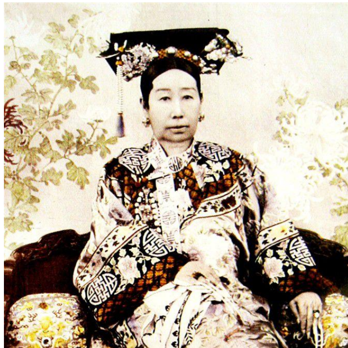
Enkekeiserinne Cixi (1835-1908) i det kinesiske Qing-dynastiet