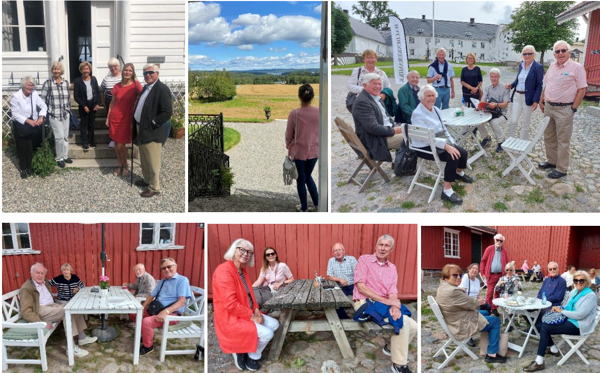
Et knippe turdeltakere på Orød og Rød