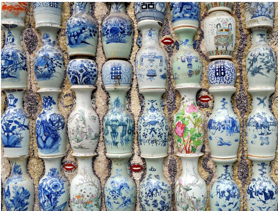
Vegg i China Porcelain House i Tianjin, Kina.

Tid og sted: Torsdag 9. juni klokken 16 i Storsalen på Schafteløkken