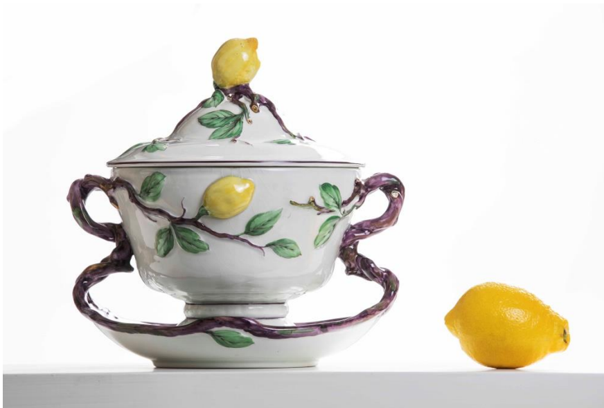
Terrin, Rörstrand Museum

Eller hva med en tur til Lidköping? På Läckö slott vises utstillingen «Färg och form: 1700-tals fajanser från Östesjön», og på Rörstrand Museum kan du se utstillingen «Den keramiska trädgården».