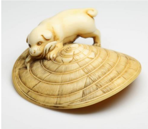
Netsuke i elfenben, valp på en hatt, 1800-tallet