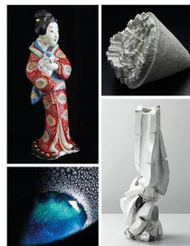
KERAMISKT CENTER I HÖGANÄS 24 MARS-2 SEPTEMBER 2018