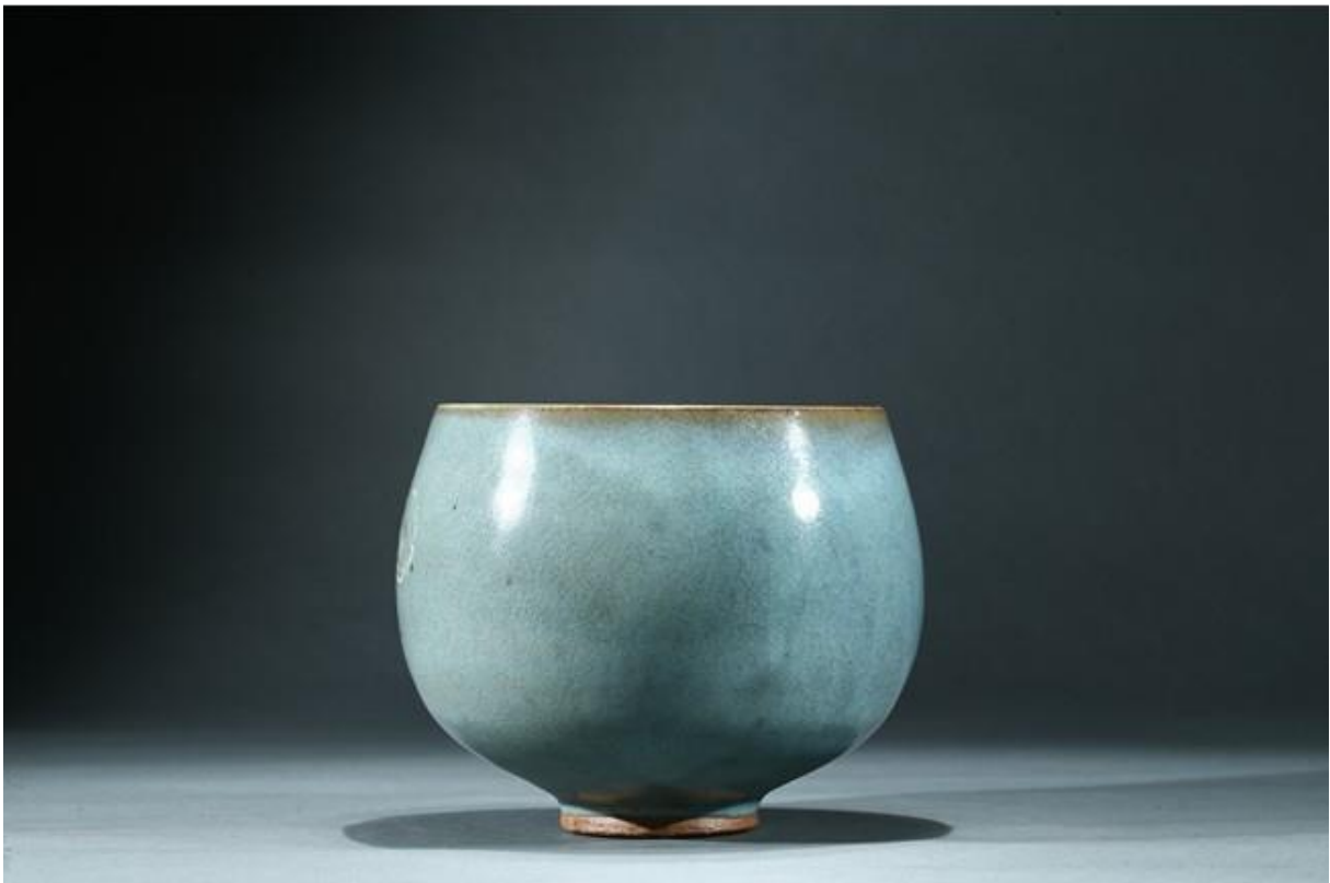
Jun ware waterpot. H: 12,7 cm, d: 15,2 cm