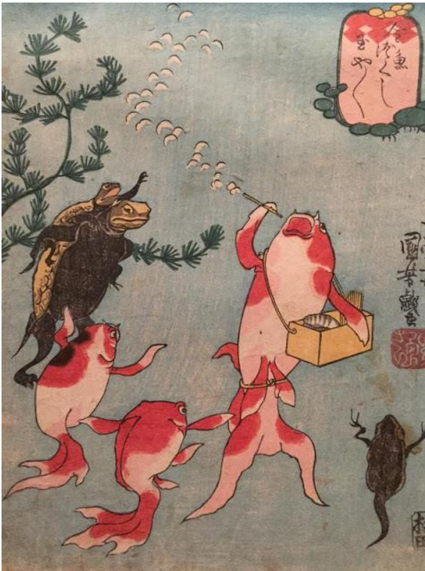
Utagawa Kuniyoshi (1798-1861), Såpebobleselgeren fra Gullfisk-serien