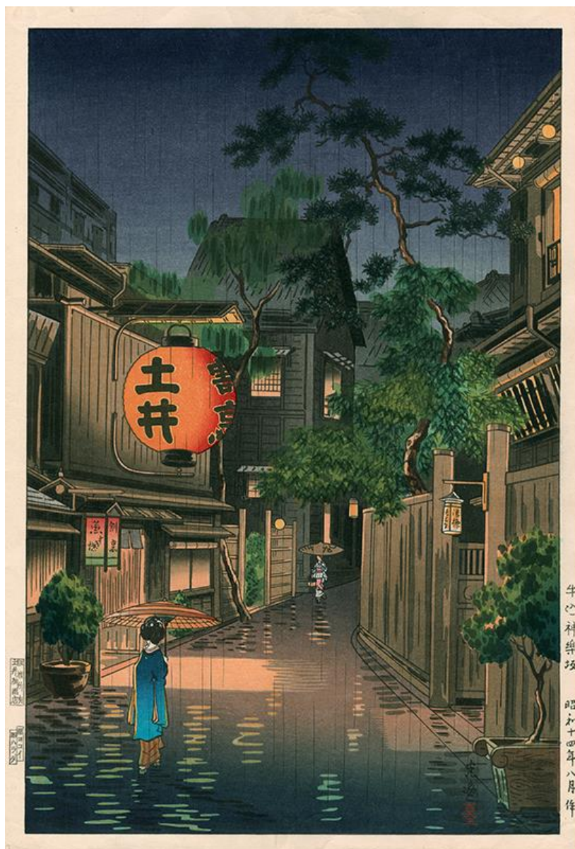
Tresnitt av Tsuchiya Koitsu, tittel: Ushigome Kagurazaka. Japan, 1939

Nå er mørketiden over oss, så da er det viktig å hegne om lyspunktene, enten de er i form av stearinlys i stuen, venner, fullmånen, utelykter, japanske tresnitt, eller NSOK-aktiviteter!