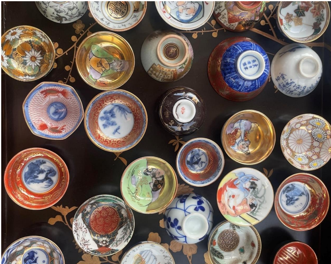
Et knippe vakre sake-kopper, detalj.

Under oppholdet i Japan, var et av tidsfordrivene mine å gå på antikvitetsmarkeder. De fant som regel sted ved et tempel eller et shrine. Det var ofte vel så mye stemningen og atmosfæren på disse hellige stedene, som varene som ble budt frem som gjorde at jeg ofte besøkte disse markedene. Den flotteste tiden på året å besøke antikvitetsmarkedene, var på høsten når fargene var på sitt beste. Da glitret solstrålene i høstløvet så man fikk inntrykk av at trekronene stod i flammer og de små lønnebladene ble gjennomsiktige av sollyset og minnet om florlett papir i rødt og gull. Porselenet som ble tilbudt under trekronene var ofte like fargerikt som høstløvet og her fant jeg mange skatter. Flere av disse var sake-kopper.