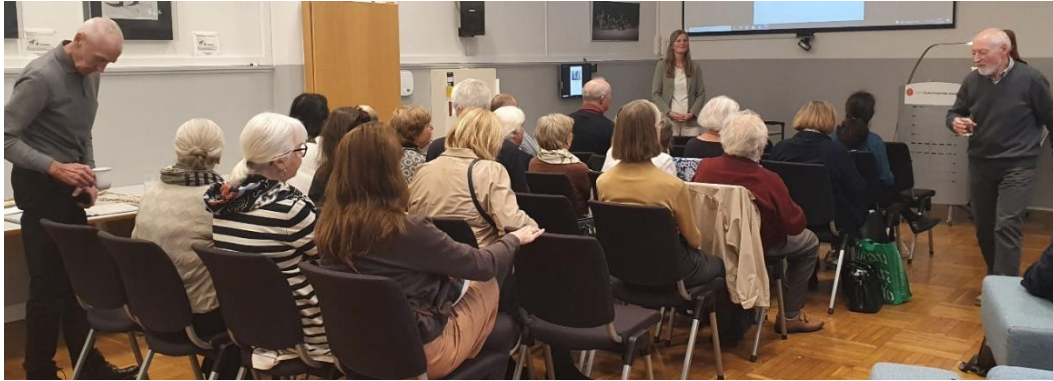
Fra Pecha kucha-dagen.