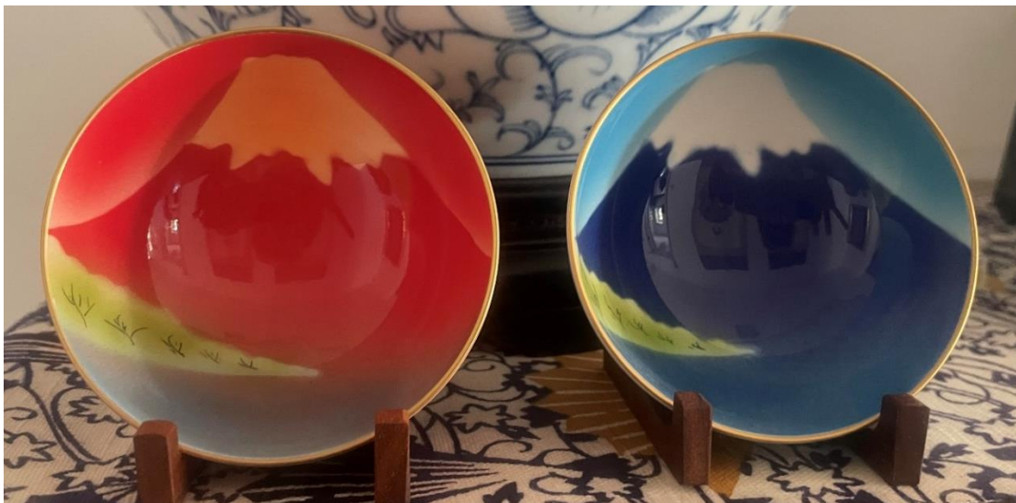
Sake-kopper med motiv av Fuji-san i sommer- og vinterdrakt.

I samlingen min er det imidlertid ett sett med sake-kopper som skiller seg ut. De er av nyere dato og det er kun laget 100 eksemplarer. De forestiller rød og blå Fuji-san. Rødfargen symboliserer fjellet i soloppgang i den varme årstiden mens blåfargen symboliserer himmelen og fargen fjellet har om vinteren. Settet fikk jeg i 2015 av en japaner min mann jobbet mye med. Han hadde fått det av en forretningsforbindelse, men valgte å gi det til meg fordi han visste jeg ville ta godt vare på det!»