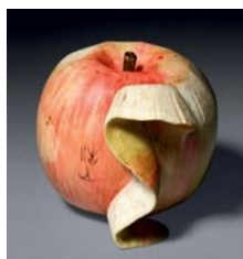
Okimono i elfenben