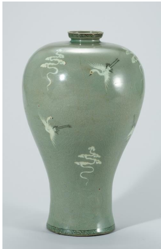
Prunus vase med traner og skyer. Korea, 1150-1200. Høyde 30 cm. National Museum of Korea