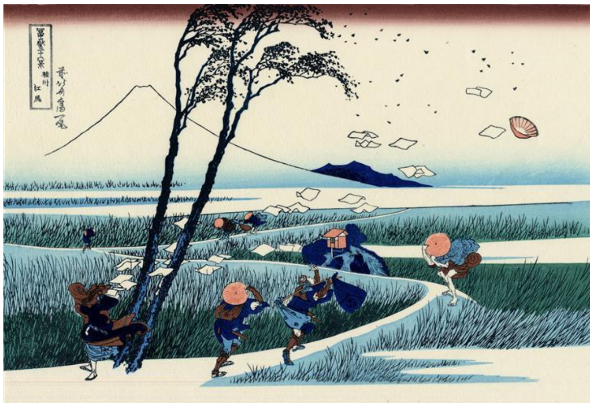
Katsushika Hokusai (1760-1849) Tresnitt, «Ejiri in the Suruga Province». Fra serien “Thirty-six Views of Mount Fuji”. Japan, ca 1832

Hold på hatten, nå er det senhøst! Nå på slutten av året kommer dette årets siste nyhetsbrev. Vi kan se tilbake på et aktivt år i foreningen, med fine, lærerike, sosiale treff, nyttårsfeiring, bokmarked, langtur og korttur, seminar og NSOK-dag. På hjemmesiden vår www.orientalskkeramikk.com ligger programmet ute, der kan man gå tilbake og se hva året har budt på. Vi har fått flere nye medlemmer, og gleder oss til å bli kjent med - og dele nye opplevelser - med hverandre, noen allerede på julemøtet, andre på nye treff i 2025.