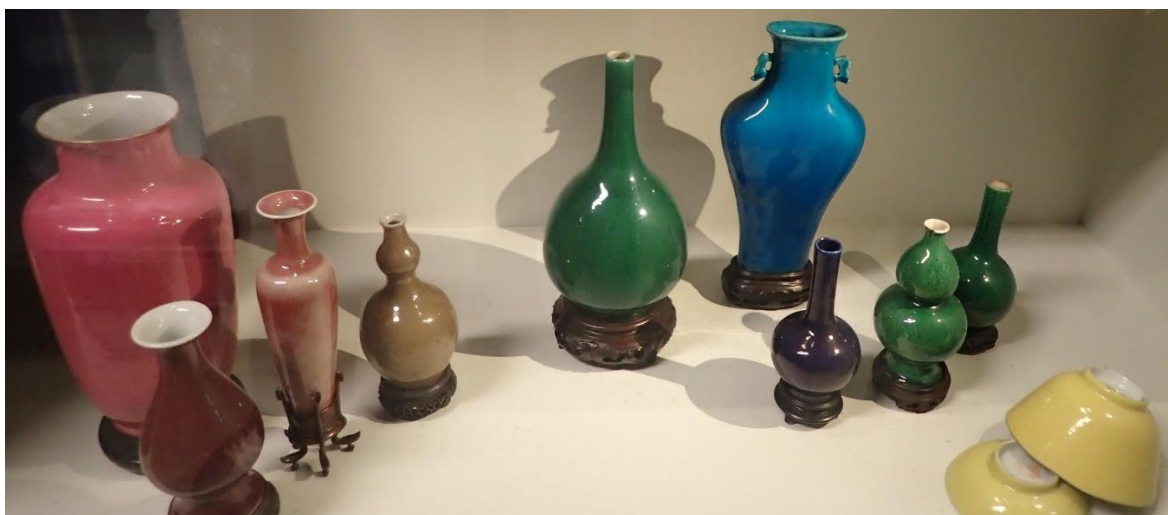
Monokromer i Historisk museums gamle Øst-Asia-utstilling i 4. etasje.