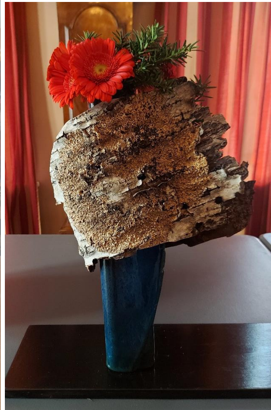
Ikebana av ikebanamester Lisbeth Lerum