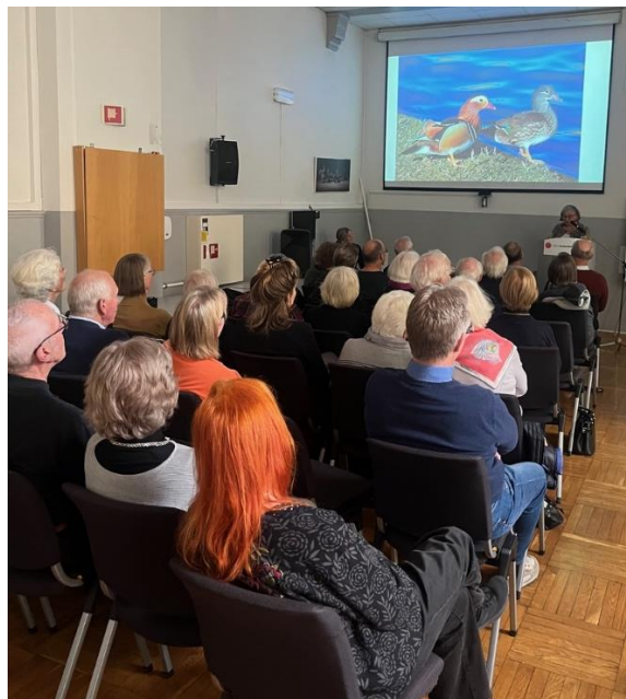
Interessert publikum på Pecha kucha-seminar.