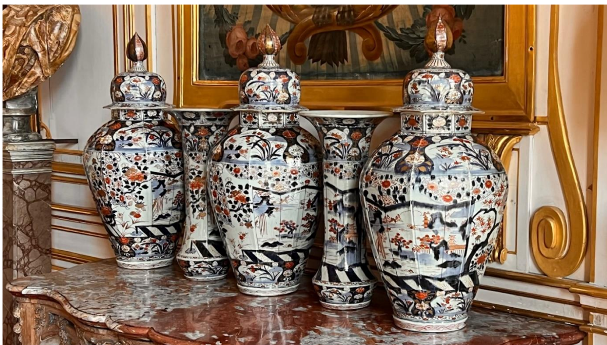
Japansk imari garnityr i Palais Rohan, Strasbourg